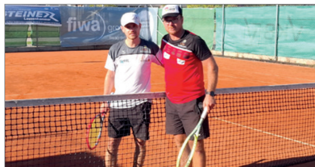
Finale VM 2025