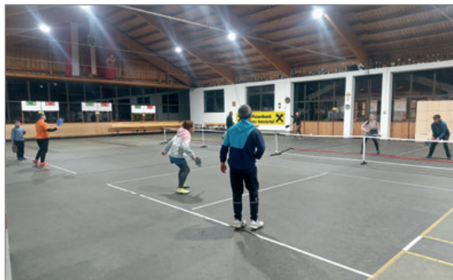
Action beim Open Play im November 2025