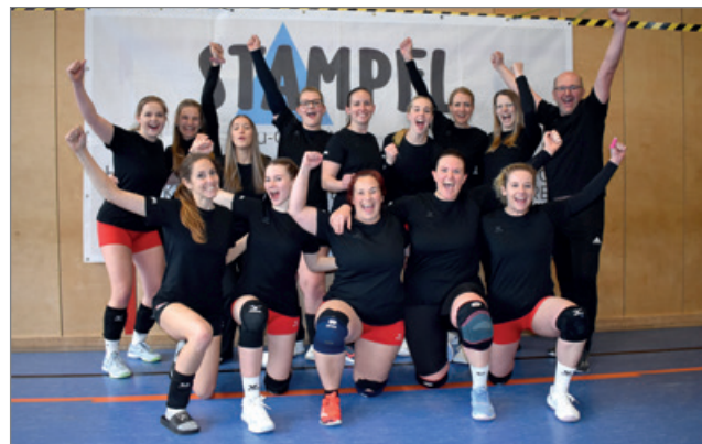
Meister Damen 1 24-25.

Ein ganz besonderer Moment der jüngeren Vereinsgeschichte bleibt der 15. März 2025. Nach einer starken Saison durfte sich die Damen 1 über den Meistertitel in der Kreisliga und damit über den verdienten 1. Tabellenplatz freuen. Mit diesem Erfolg gelang zugleich der Aufstieg in die Bezirksklasse, in der das Team heute erfolgreich antritt.