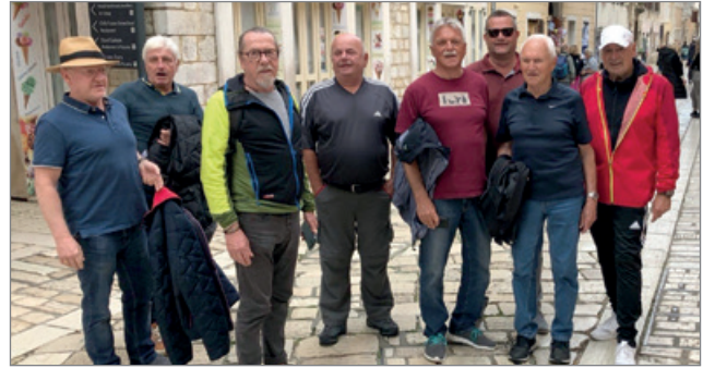
Oldies in Umag 2023

In der Mannschaft TCO 2 sind unsere Nachwuchstalente im Spielbetrieb. Diese steigern Jahr für Jahr ihre Spielstärke und sammeln entsprechende Spiel-Erfahrung.