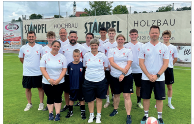
Betreuer Camp 2025

In jüngerer Vergangenheit wurden 2023 und 2025 jeweils zum Ferienbeginn dreitägige Trainingscamps für den eigenen Nachwuchs organisiert. Die Teilnehmer erhielten dabei eine komplette Fußballdress, die von Sponsoren finanziert wurde. Den gelungenen Abschluss bildete jeweils ein gemeinsames Grillfest mit den Eltern.