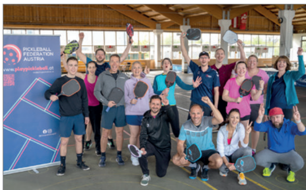
Das 1. Ostermiething Open Turnier in 2024