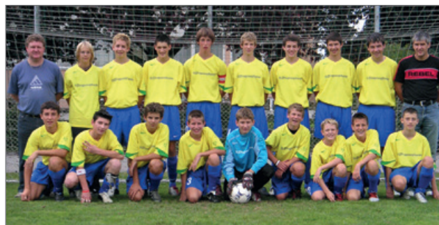
U17 Leistungsliga 2006