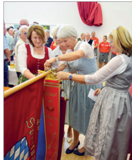
Fahnenpatinnen mit neuem Fahnenband