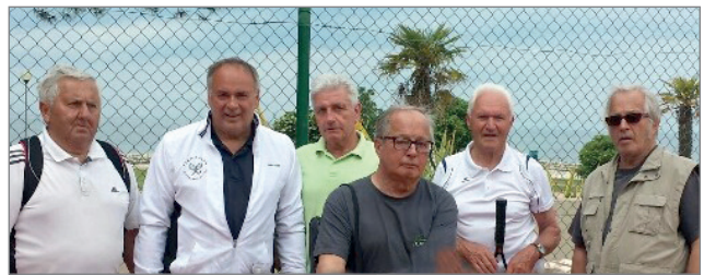
Oldies in Umag 2016

Eine OLDIES-Mannschaft ist in der Doppel-Meisterschaft Ü 50 am Start.