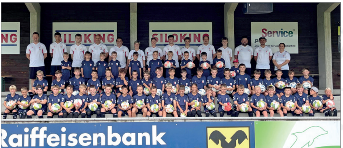
Teilnehmer Camp 2025

Ein wichtiger Bestandteil zur Finanzierung der Nachwuchsarbeit ist das „100er Club - Jugend Sponsoring“. Durch ihre Beiträge unterstützen mittlerweile weit über 100 Mitglieder gezielt die Förderung der Kinder und Jugendlichen des Vereins und zeigen damit ihre enge Verbundenheit zum UFC Stampfl-Bau Ostermiething. Als sichtbares Zeichen des Dankes werden die Unterstützer auf der Sponsorentafel am Eingang der Stampfl-Bau Arena angeführt.