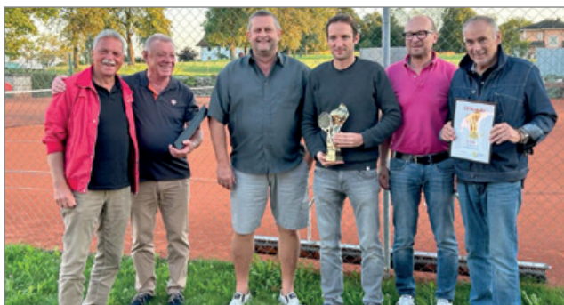
Weilhartcup Siegerehrung 2023