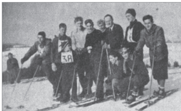
1. Union-Bezirksmeisterschaft St. Johann am Walde 1954