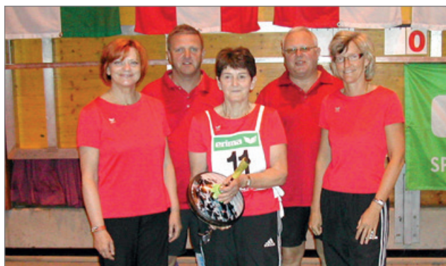
ÖM Mixed 2009 3. Platz in Pistorf

Gemeinsam traten unsere Damen und Herren bei den Mixed Wettbewerben und auch die Seniorenmannschaft besonders stark auf. Eine Silber- sowie drei Bronzemedailien bei Österreichischen Meisterschaften zeugten von Teamgeist, Zusammenhalt und sportlicher Klasse. Auch der Aufstieg der Herrenmannschaft in die Bundesliga im Jahr 2022 war ein weiterer Erfolg.