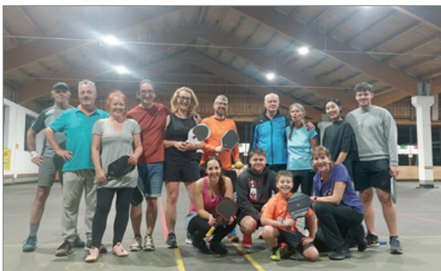
Open Play im Sommer 2024 in der Riedersbacher Europameisterhalle

Pickleball zählt weltweit zu den am schnellsten wachsenden Sportarten – nicht nur in den USA, wo es erfunden