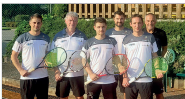
Aufstieg TL Braunau 2024