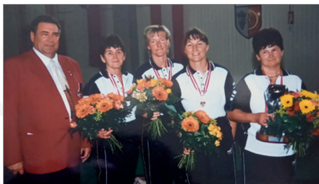
Staatsmeister Damen 2001 in Seiersberg