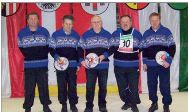
ÖM Senioren 2010 Dornbirn 3. Platz