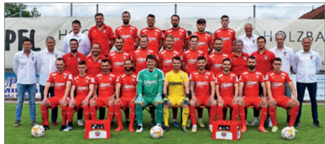
Meister Mannschaft 2021-2022