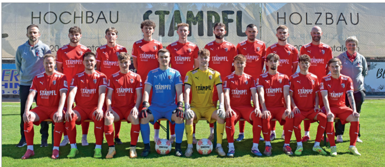
Juniors Meistermannschaft 2026