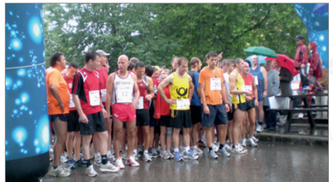
Start des 1. Salzachlaufes 2009