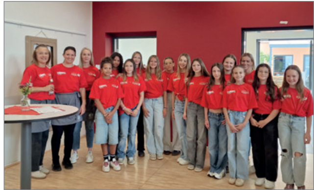
Stellvertretend für die vielen, vielen freiwilligen Helferinnen und Helfer