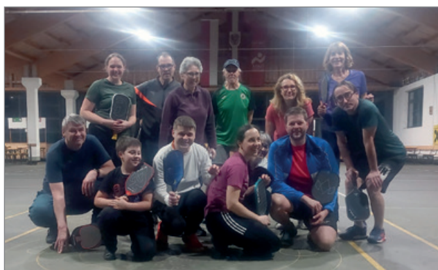
Gruppenspaß beim Open Play im März 2026

Was im Sommer 2023 auf die Initiative von Heide und David Forman, die die Sportart aus den USA mitbrachten, mit einem wöchentlichen Termin am Mittwochabend begann, entwickelte sich rasch weiter: Heute wird zweimal pro Woche – dienstags und sonntags – trainiert und gespielt. Für die erste Wintersaison 2023/2024 stand zunächst die Turnhalle der Volksschule zur Verfügung. Dank der Unter-