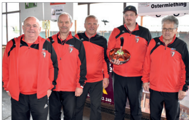
Aufstieg Bundesliga 2022