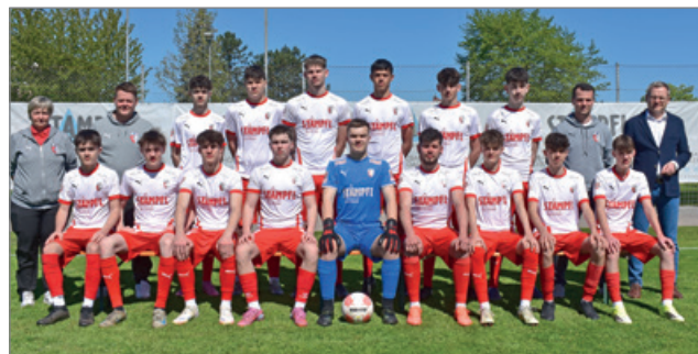
Juniors Reserve 2026