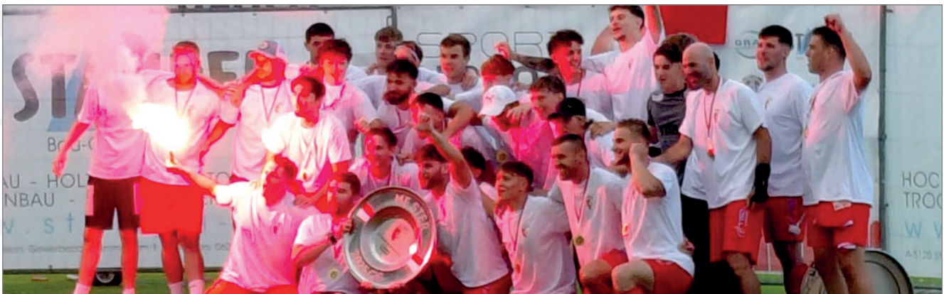
Als Draufgabe wurden die UFC Juniors in der 2. Klasse Südwest Meister