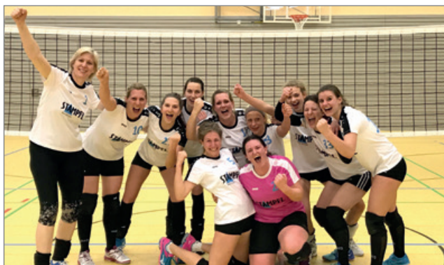
Meister Damen 1 2018

In den folgenden Jahren qualifizierten sich regelmäßig Mannschaften für die oberbayerischen Meisterschaften in den Altersklassen U12 bis U20. Gleichzeitig wuchs die Breite des Spielbetriebs stetig: Jugendteams, Damen- und