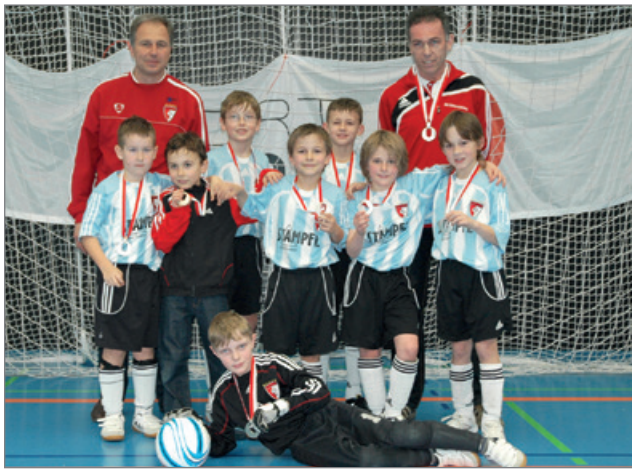
Vize LM 2011

feldplätzen um den Turniersieg. Die Heimmannschaft erreichte dabei den ausgezeichneten dritten Rang.