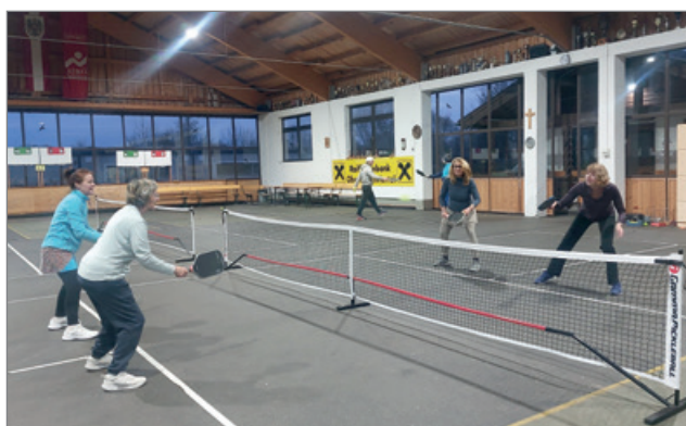
Damen Doppel beim Open Play im März 2026

wurde, sondern auch in vielen europäischen Ländern. Mittlerweile wird die Zahl der Spieler weltweit auf 48 bis 50 Millionen geschätzt. Die Sportart begeistert nicht nur durch ihre Dynamik, sondern auch durch das soziale Miteinander auf und neben dem Spielfeld.