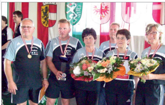
Staatsmeisterschaft Mixed Riedersbach 2008 3. Platz