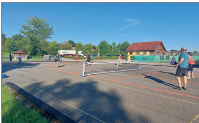
Sommer 2023 auf dem Stockschützenplatz bei der Mittelschule

21. Juni 2023: Über den Stockschützenplatz der Sportunion hallt lautes Lachen. Spaziergänger bleiben neugierig stehen, machen einen kleinen Umweg – und entdecken ein mit Neonfarben markiertes Spielfeld, vier flinke Spieler mit kurzen Schlägern und einen farbigen Ball, der durch die Luft saust. Mal sprinten die Spieler zur Linie am Netz und liefern sich rasante Ballwechsel, mal springt der Ball auf und wird mit einem gezielten Schlag zurück ins gegnerische Feld befördert.